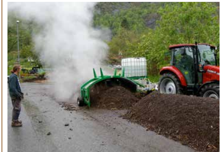
Elever fra Sogn jord- og hagebruksskule driver med kompostering.