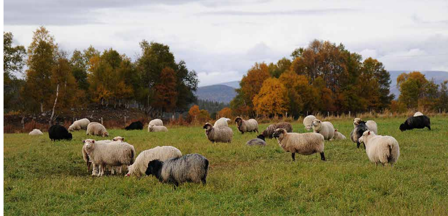
Vekstskifte og målrettet beiting er to av tiltakene vi kan bruke for å få mer karbon tilbake i joda.